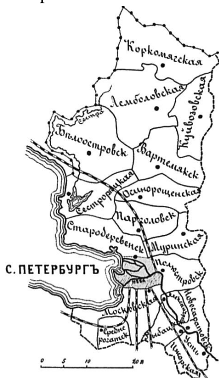
Карта Петербургского уезда 4

Петр I провел реформу местного управления в 1708 г. - было создано восемь губерний во главе с губернаторами, в 1719 г. их число увеличилось до 11. Вторая административная реформа поделила губернии на провинции, а с 1727 г. провинции разделялись на уезды, а уезды на волости. Территория Карельского перешейка вошла в состав Ингерманландской губернии, переименованной в 1710 г. в Санкт-Петербургскую. Территория современного Куйвозовского сельского поселения относилась к Санкт-Петербургскому уезду и занимала территорию Лемболовской, Куйвозовской и Коркомякской волостей.