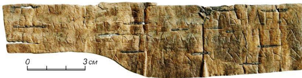
Грамота №1081, пл. 34, гл. 335, кв. 28, №3, 7 июня 2016

Приложение 1. Фото берестяной грамоты XIV века, найденной в 2016 году в Великом Новгороде, где упоминается село Лемболово.