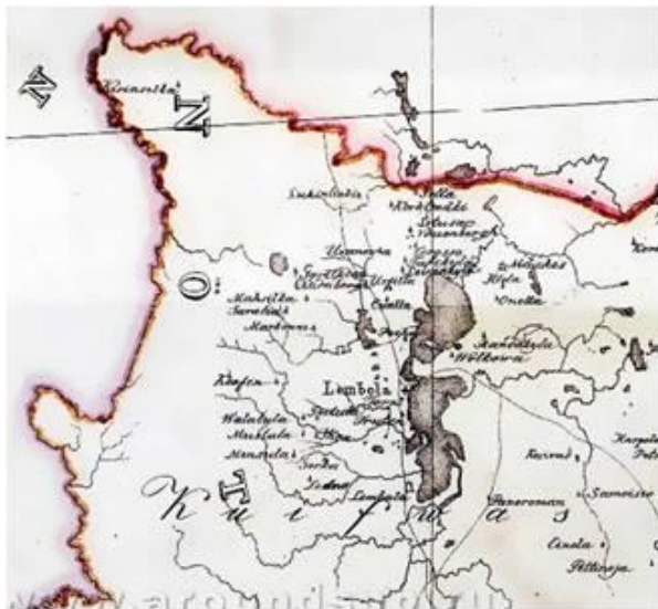
Приложение 5. Фрагмент карты 1699 г.